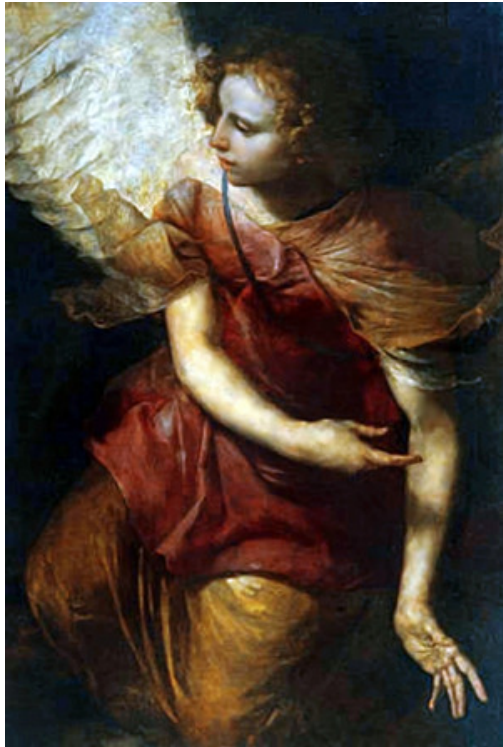
Angel (Detail) by José de Ribera

geregeerd, Satan. Tenslotte, de (eertijds) aangestelde Planetaire Vorst Caligastia. Lucifer, Satan en Caligastia zijn oneerbiedig gezegd de hoofdrolspelers in dit buitengewoon dramatische gebeuren.