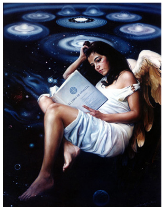
Angel by Manolo Gallardo

Met deze gegevens zijn wij verder gaan nadenken en hebben uiteindelijk gekozen voor het thema 'Familie', familie in de breedste zin van het woord. In onze maatschappij is familie een belangrijke leidraad in het dagelijks leven. Maar wat is familie precies, waar ligt de grens of kun je zelf bepalen waar je de grens wilt